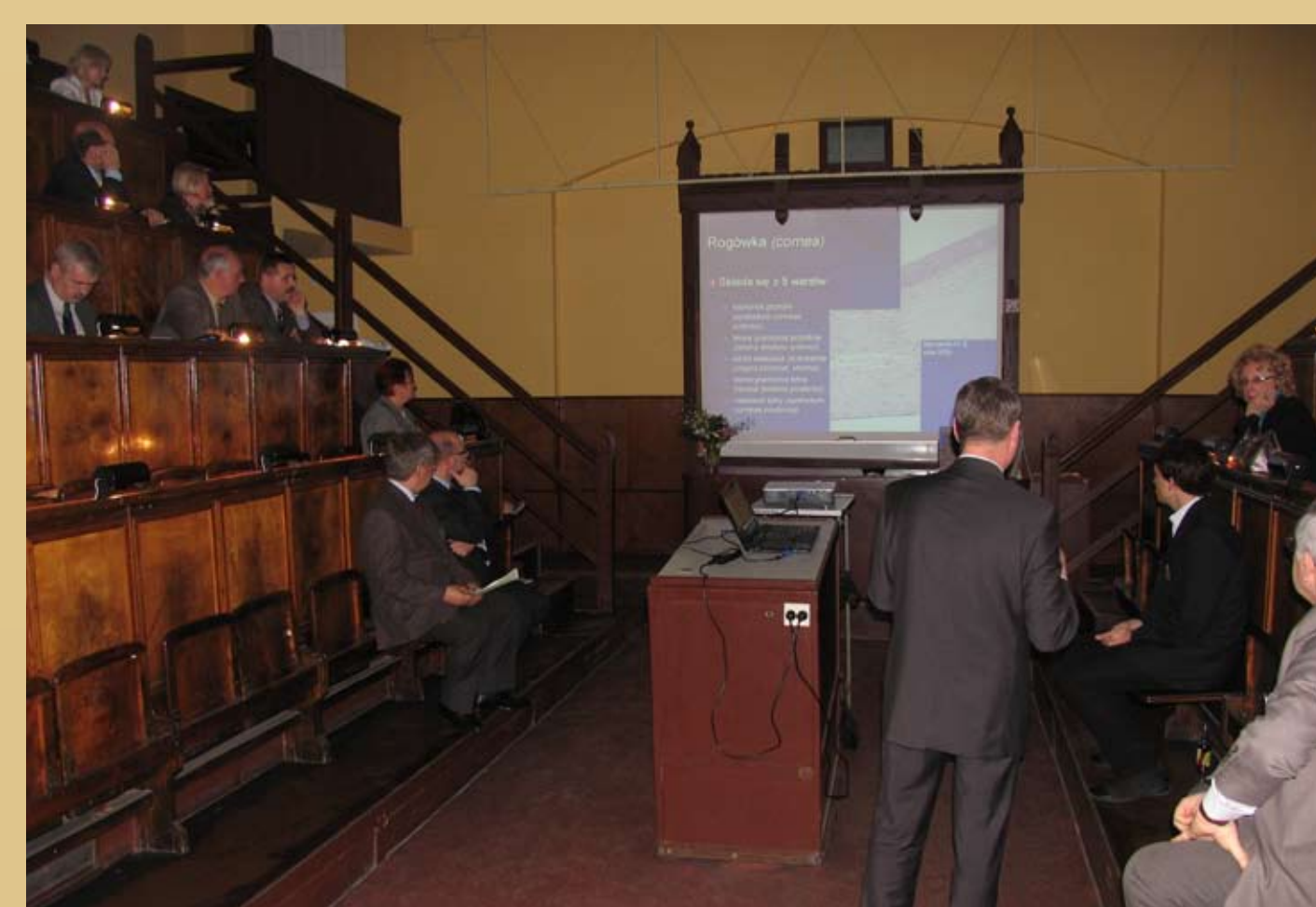
Fot. 3. Wykład inauguracyjny I Sympozjum Współczesna myśl techniczna w naukach biologicznych i medycznych, 2010 r.