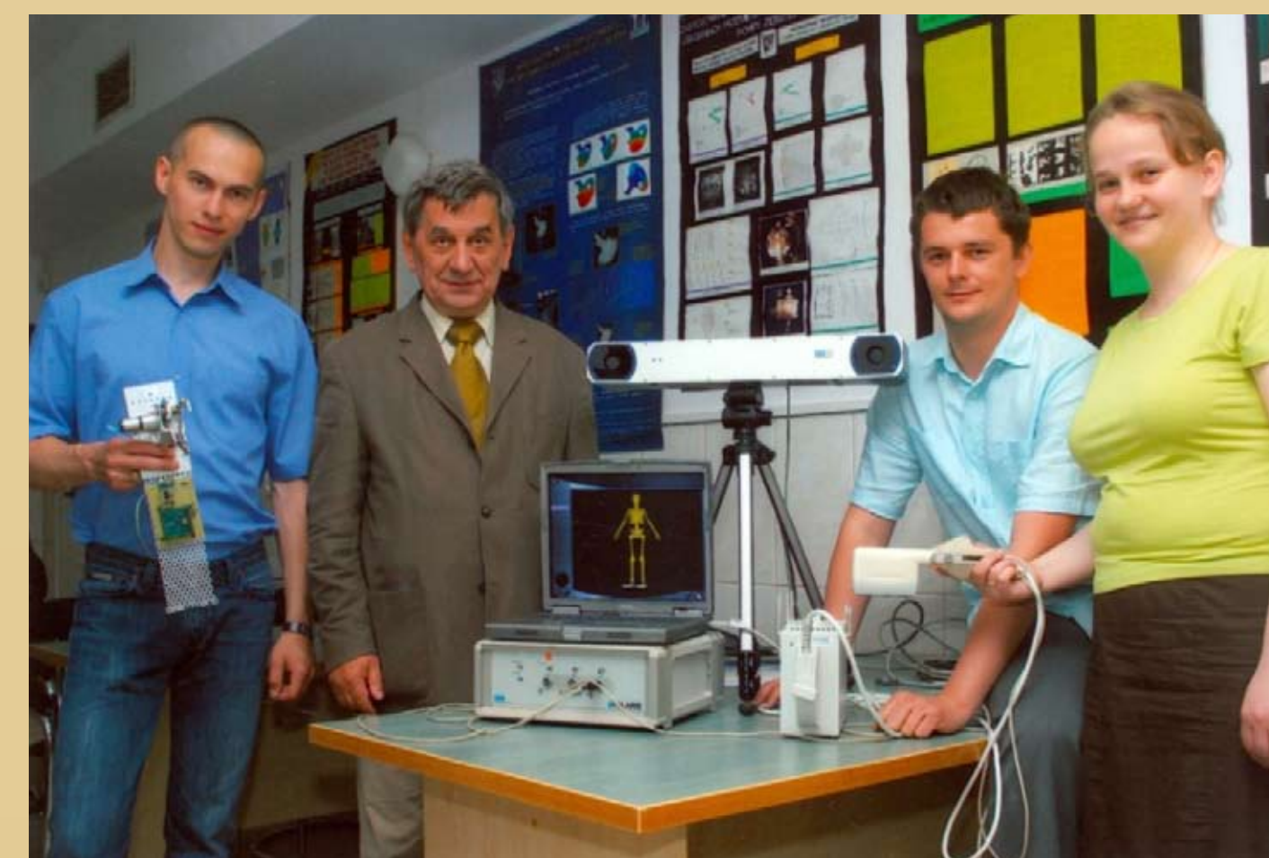
Fot. 1. Prof. Romuald Będziński ze współpracownikami.