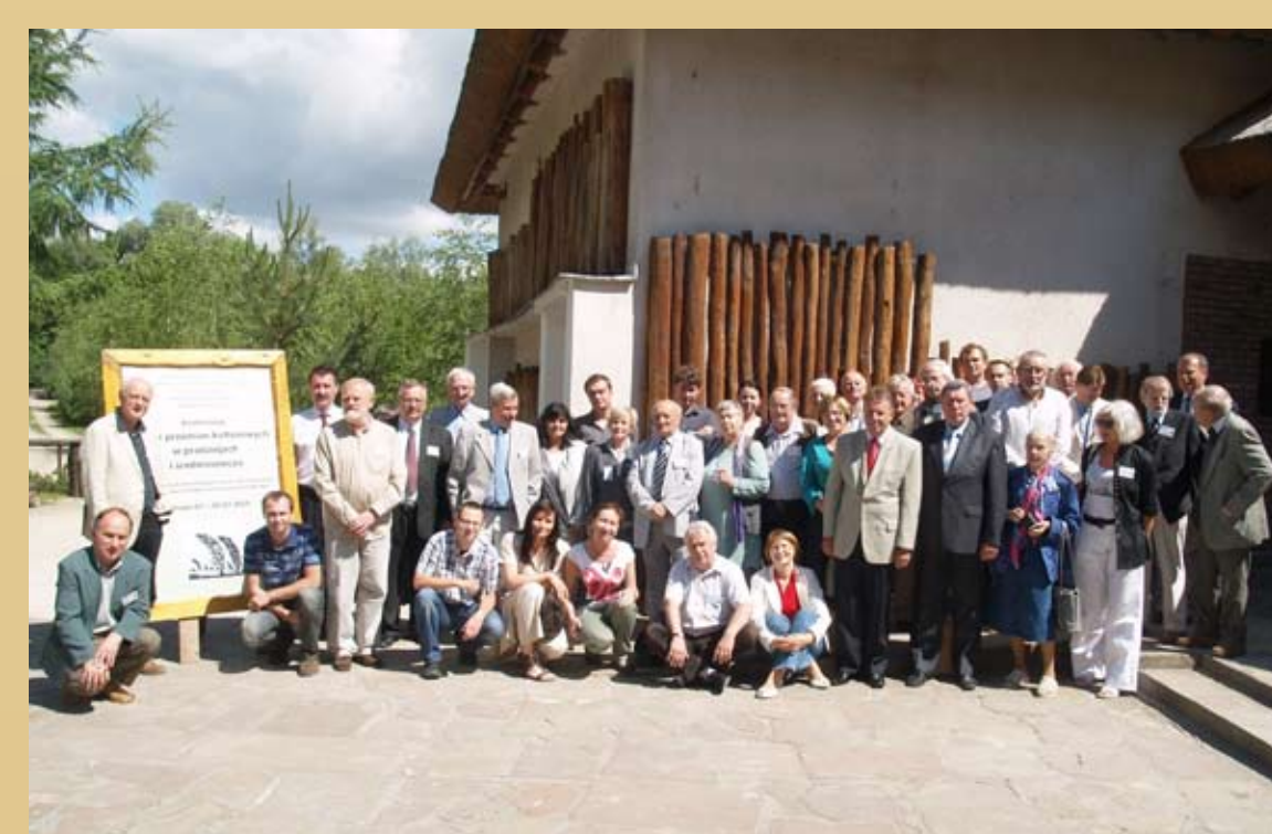
Fot. 3. Uczestnicy międzynarodowej konferencji w Biskupinie w roku 2010 „Rytmy przemian kulturowych w pradziejach i średniowieczu”.