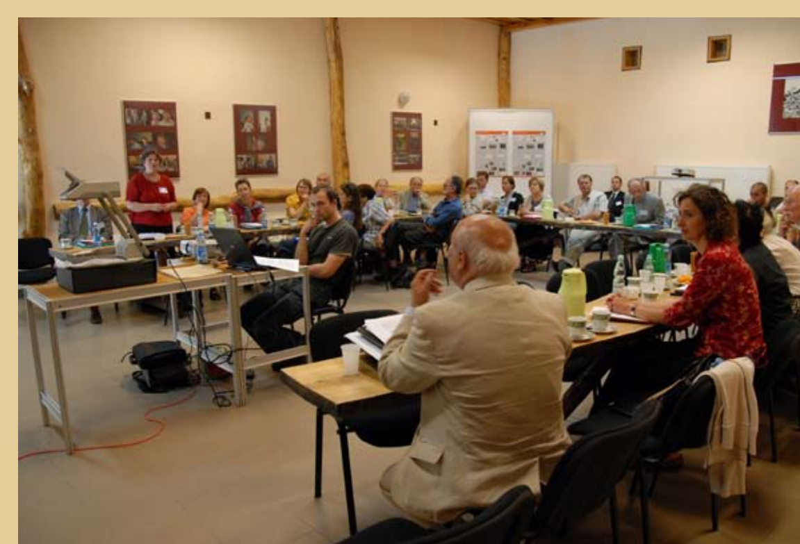
Fot. 1. Sala obrad międzynarodowej konferencji w Biskupinie w roku 2008 „Rola głównych centrów kulturowych w kształtowaniu oblicza kulturowego Europy Środkowej w epoce brązu i wczesnej epoki żelaza”.

Dalsze prace komisji będą koncentrowały się wokół dotychczas sformułowanych celów, które sprawdzają się w dotychczasowej działalności i przynoszą dobre wyniki.