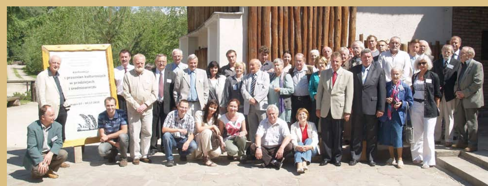
Fot. 5. Uczestnicy międzynarodowej konferencji w Biskupinie w roku 2010 „Rytmy przemian kulturowych w pradziejach i średniowieczu”.