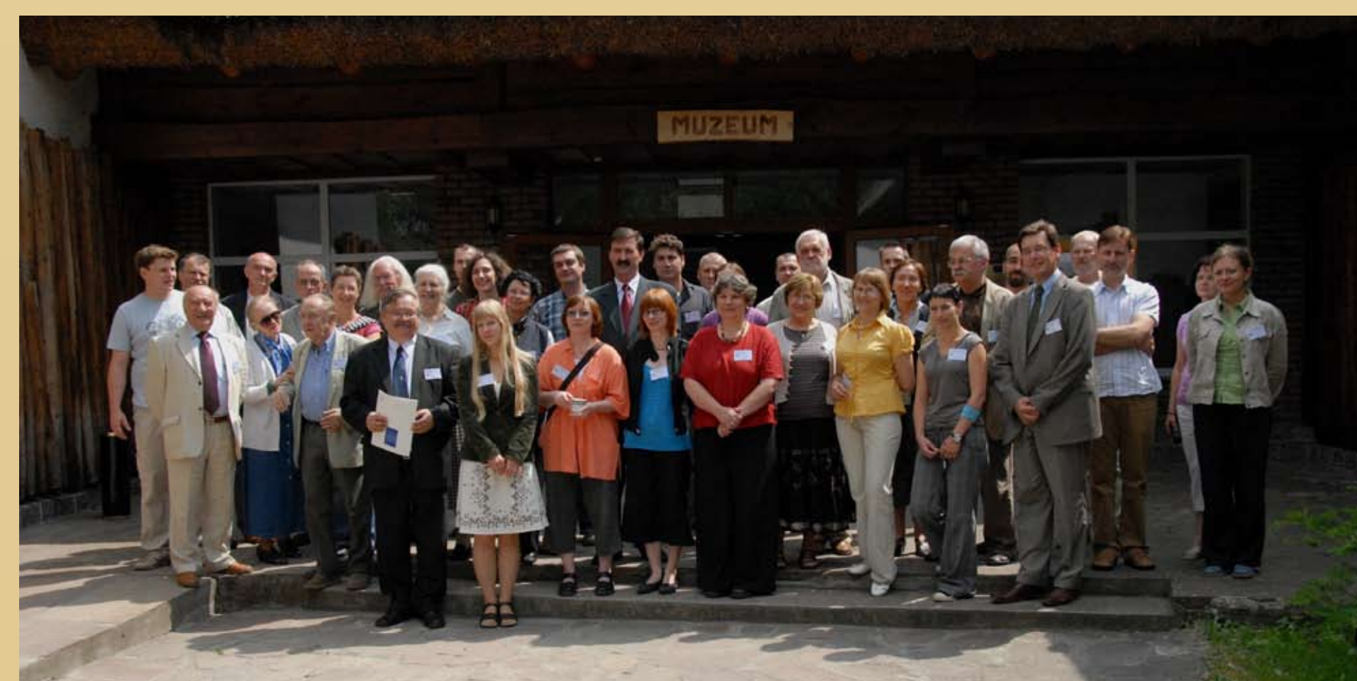
Fot. 2. Biskupin 2008. Uczestnicy międzynarodowej konferencji „Rola głównych centrów kulturowych w kształtowaniu oblicza kulturowego Europy Środkowej w epoce brązu i wczesnej epoki żelaza”.