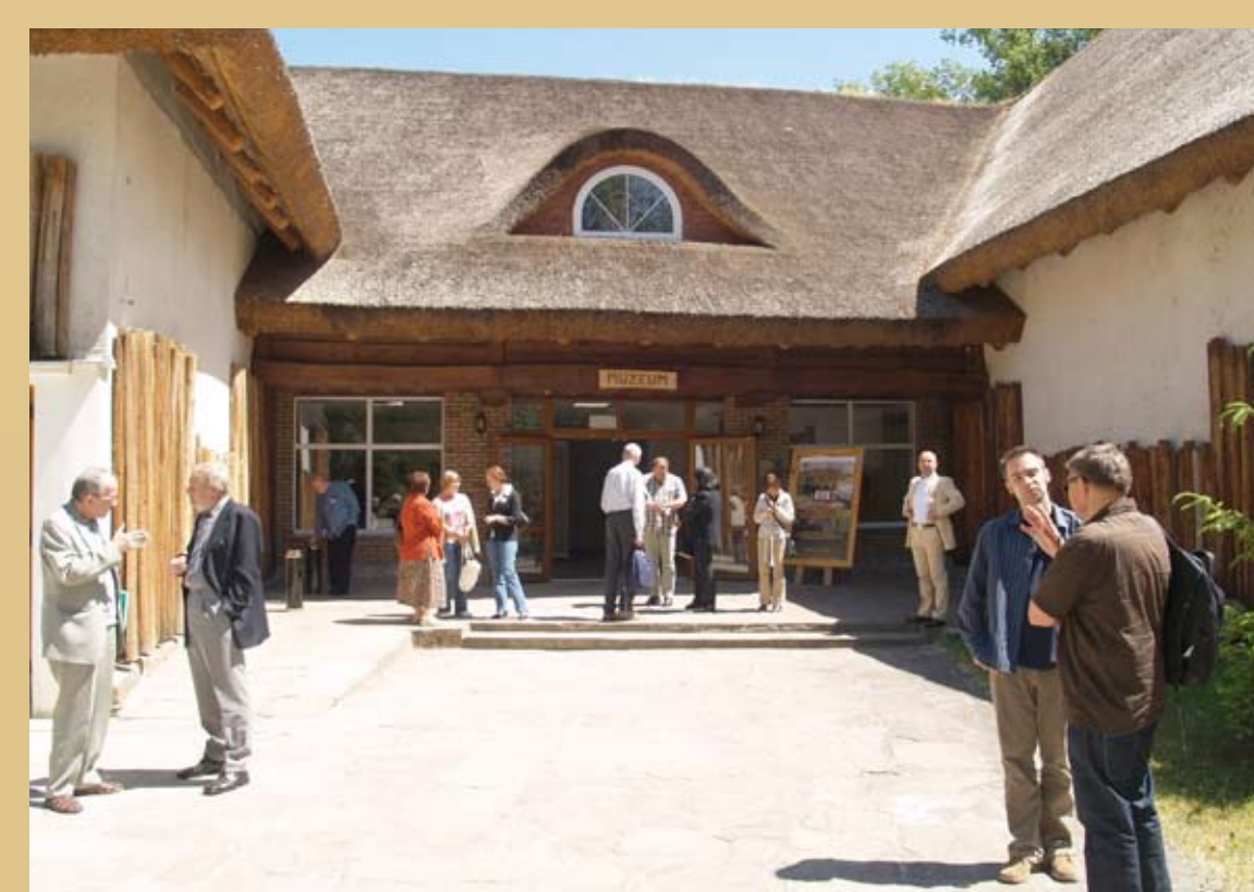
Fot. 4. Dyskusje w przerwie obrad międzynarodowej konferencji „Rola głównych centrów kulturowych w kształtowaniu oblicza kulturowego Europy Środkowej w epoce brązu i wczesnej epoki żelaza”.