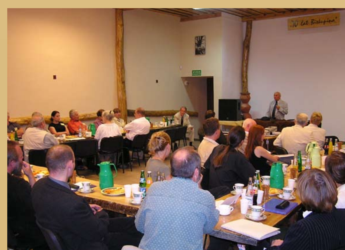
Fot. 6. Obrady międzynarodowej konferencji w Biskupinie 2004 „Architektura i budownictwo epoki brązu i wczesnych okresów epoki żelaza w Europie Środkowej”.