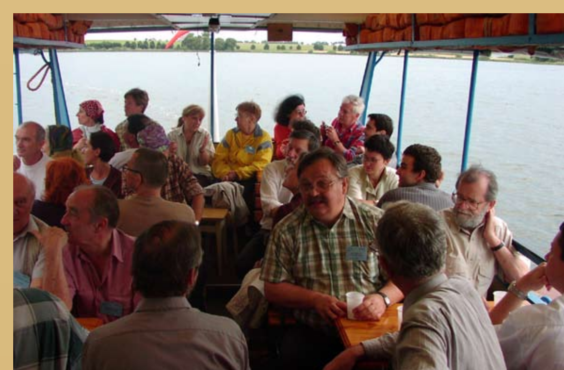
Fot. 8. Uczestnicy międzynarodowej konferencji w Biskupinie 2002 „Archeologia – Kultura – Ideologie” podczas przejazdu statkiem po jeziorze biskupińskim.