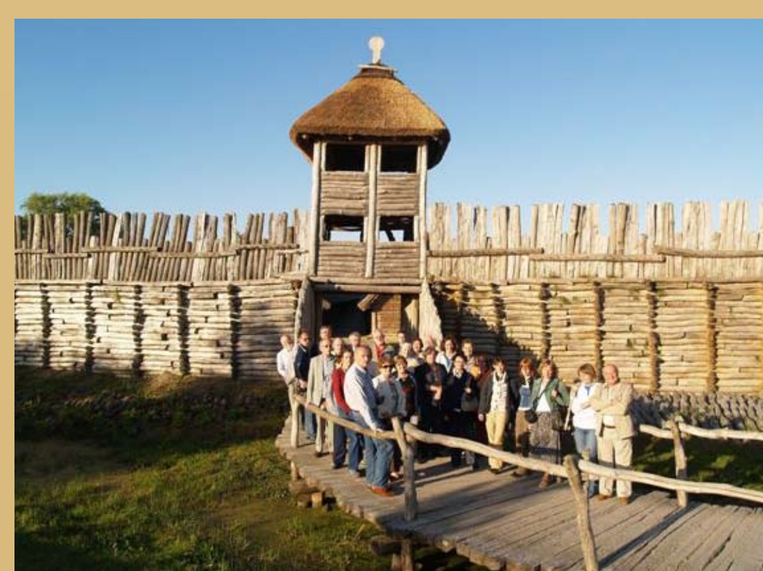
Fot. 7. Uczestnicy międzynarodowej konferencji w Biskupinie 2008 „Rola głównych centrów kulturowych w kształtowaniu oblicza kulturowego Europy Środkowej w epoce brązu i wczesnej epoki żelaza” przed rekonstrukcjami grodu.