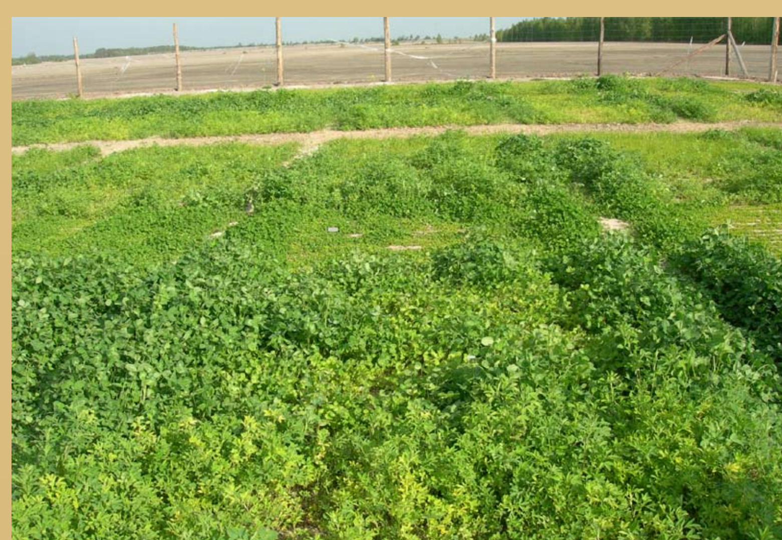
Fot. 5. Fragment zrehabilitowanego składowiska odpadów flotacyjnych.