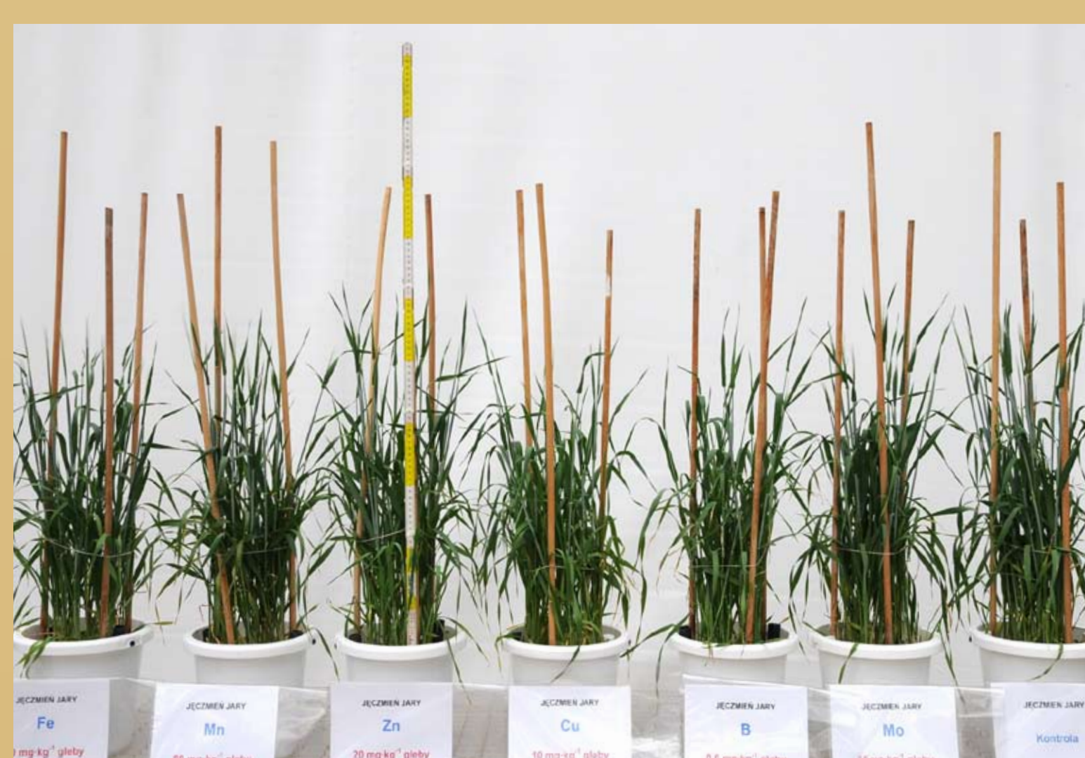
Fot. 6. Doświadczenie wazonowe z nawożeniem jęczmienia mikroelementami.