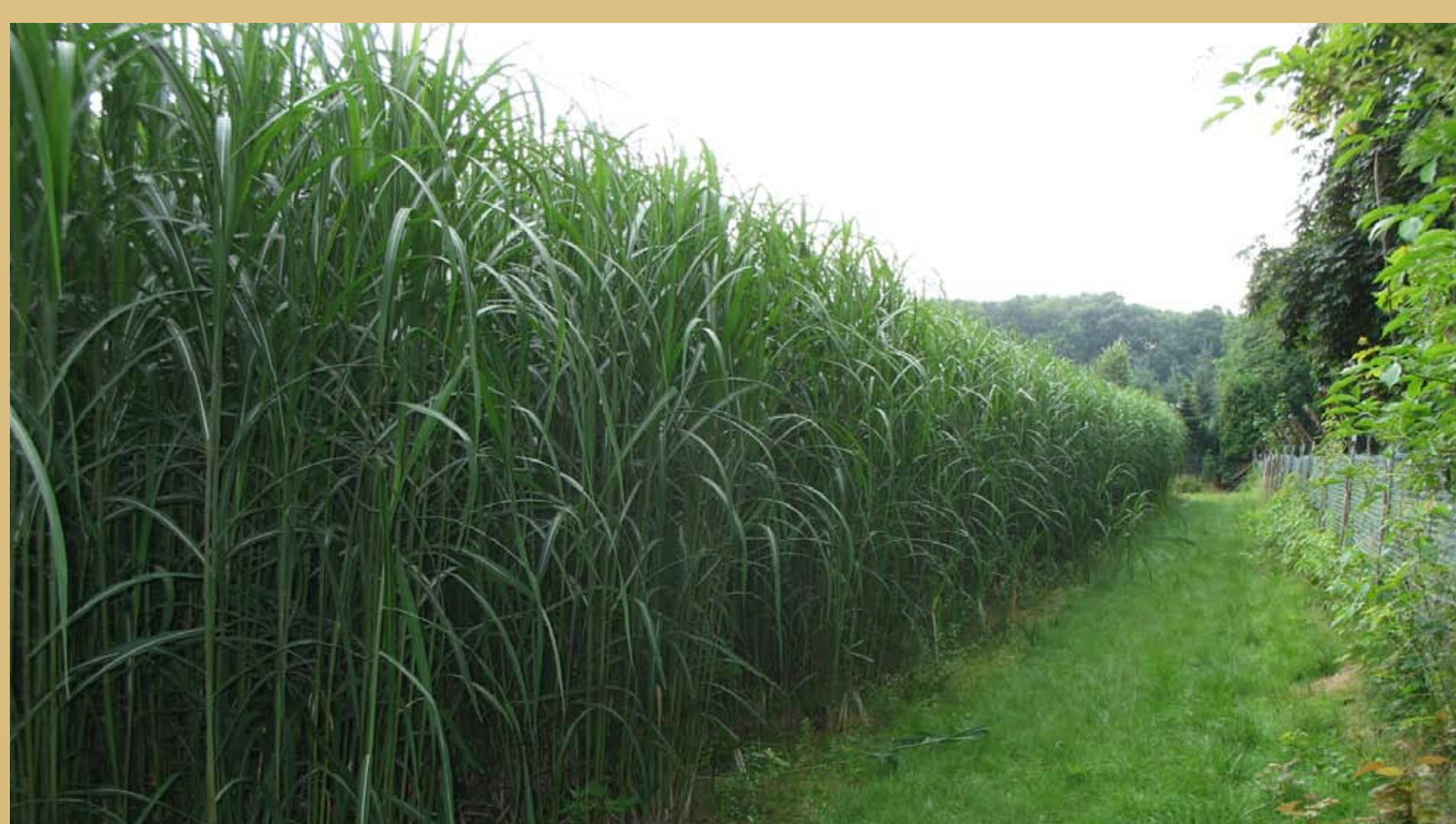
Fot. 7. Uprawa miskanta olbrzymiego na terenie Dolnego Śląska.