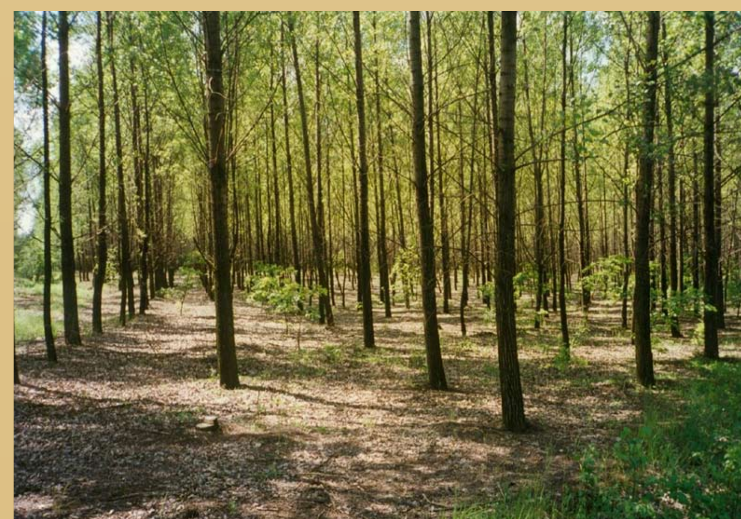
Fot. 4. Zalesiony zdegradowany obszar wokół Huty Miedzi Głogów.