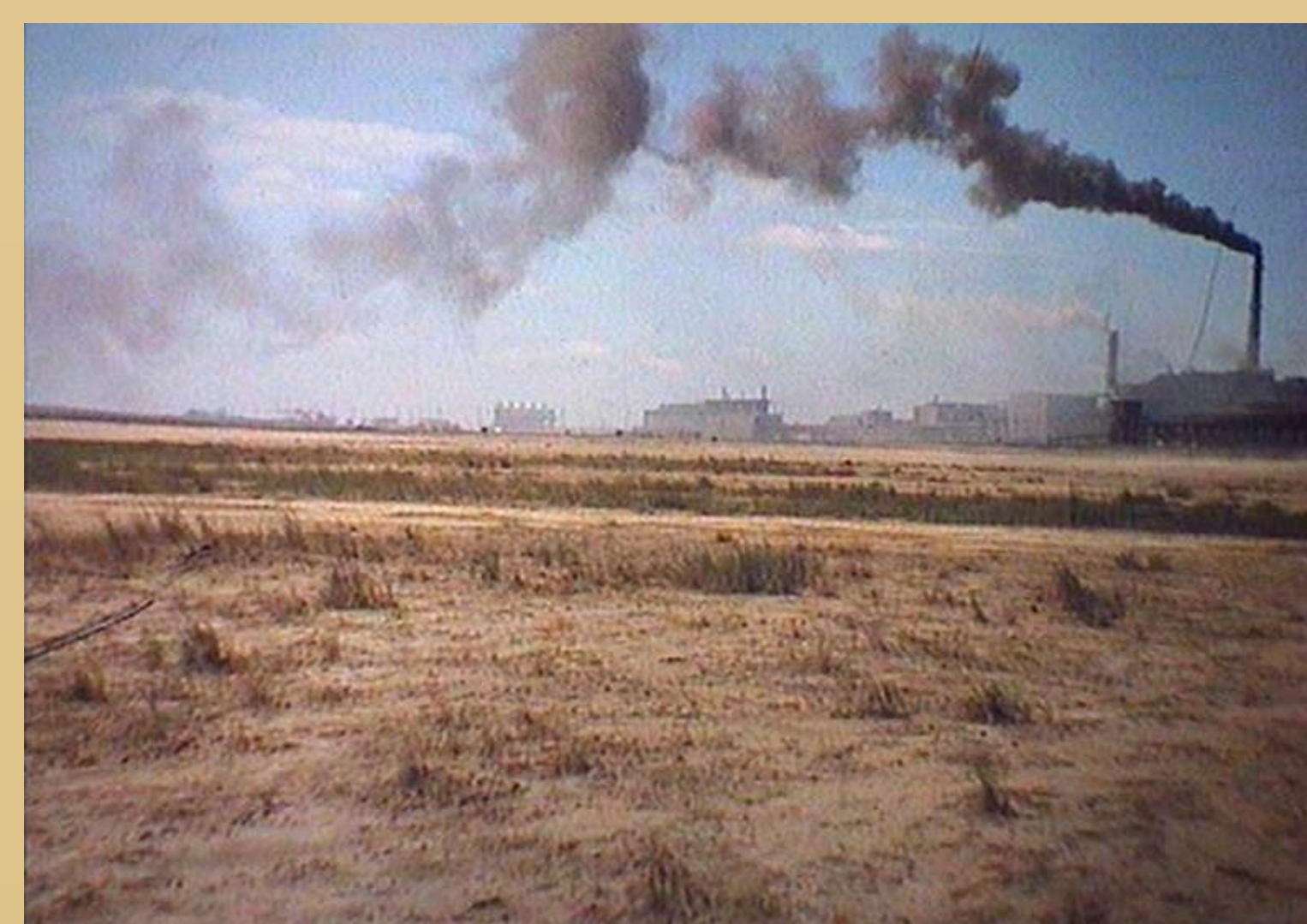
Fot. 3. Zdegradowany teren wokół Huty Miedzi Głogów.